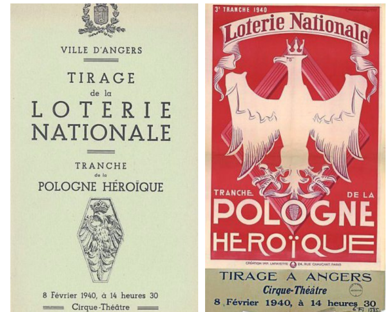
Loterie nationale, tirage de la tranche de la Pologne héroïque, affiche de Louis Marcoussis, 1940.