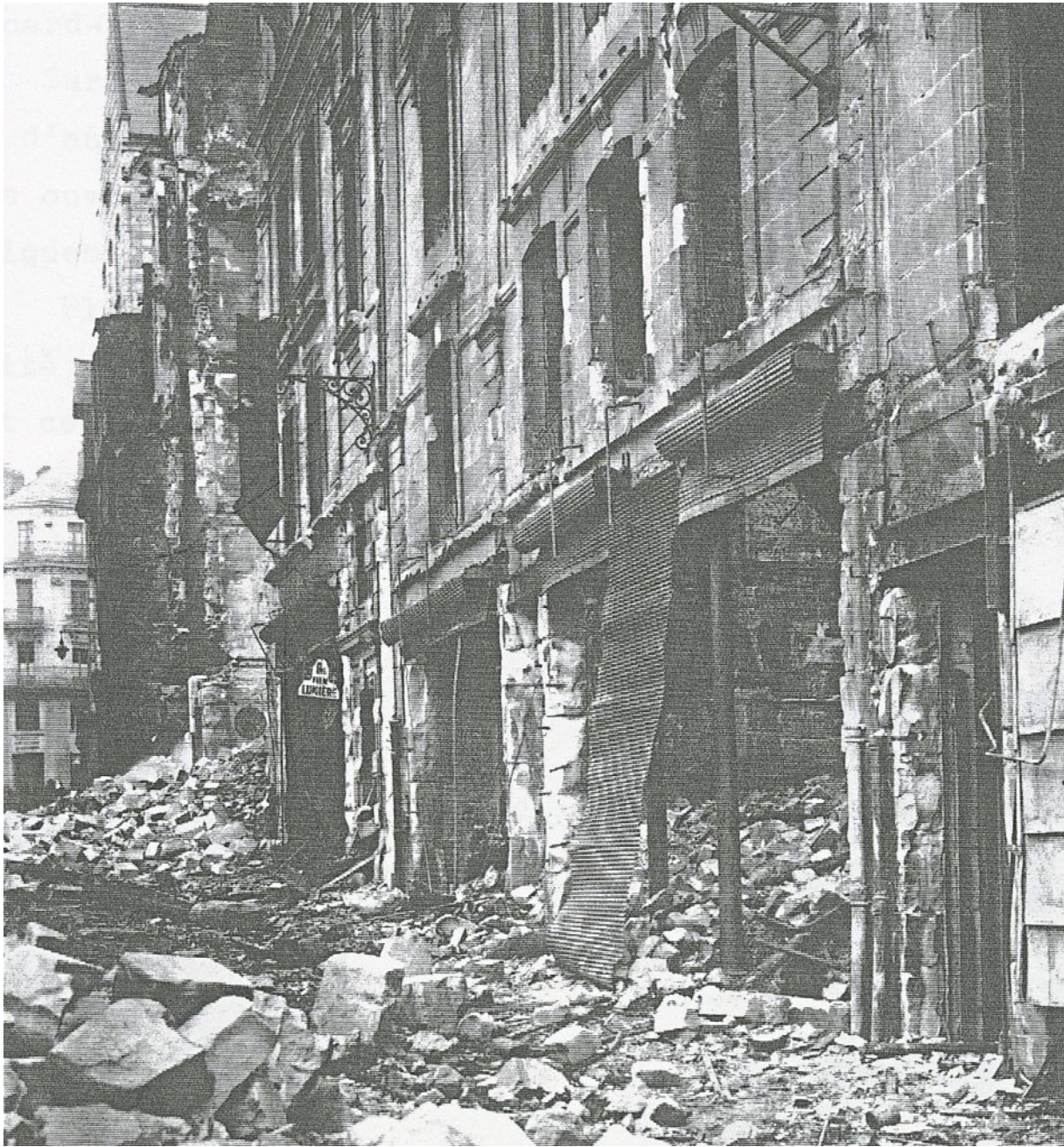
La rue Baudrière après l'incendie, le 23 novembre 1936.

Soyons francs, ce ne fut peut-être la faute de personne, mais le feu ne s'arrêta vraiment que lorsqu'il n'y eut plus rien à brûler. Ils évitèrent certainement une extension de l'incendie en arrosant les façades des maisons les plus proches, rue