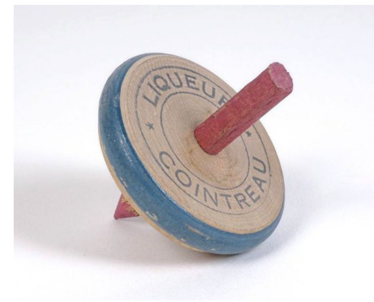
Toupie Cointreau, vers 1940.

PHOTO : ARCHIVES PATRIMONIALES ANGERS, 1 OBJ 303