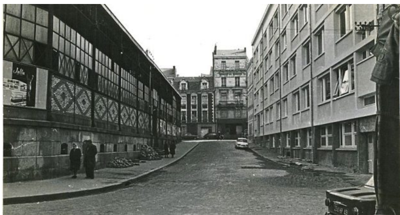
Place de la République, actuelle rue Millet, mars 1965.

PHOTO : ARCHIVES PATRIMONIALES ANGERS, COLL. ROBERT BRISSET, 9 F1 14 704