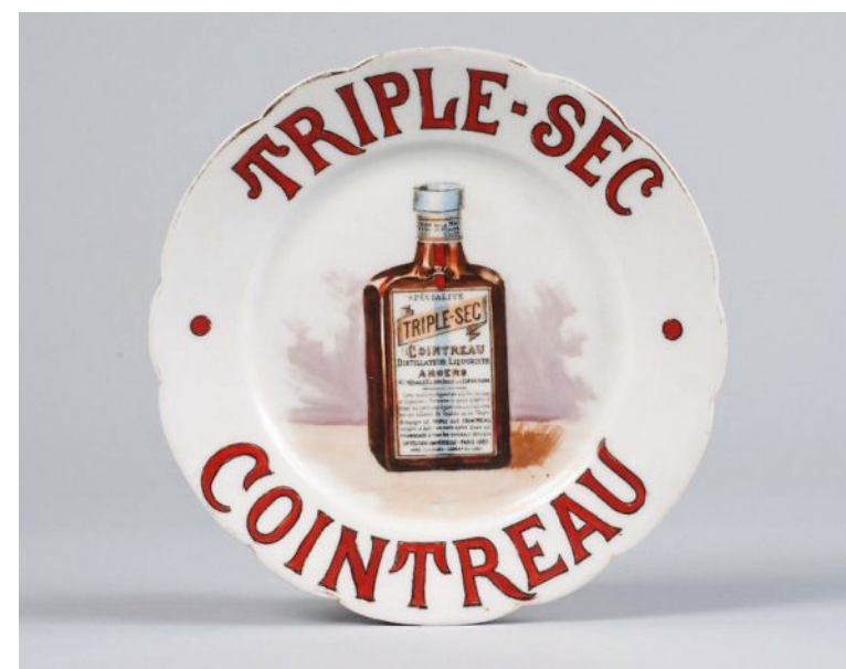
Assiette publicitaire « Triple-sec Cointreau », vers 1890.

1 OBJ 1521