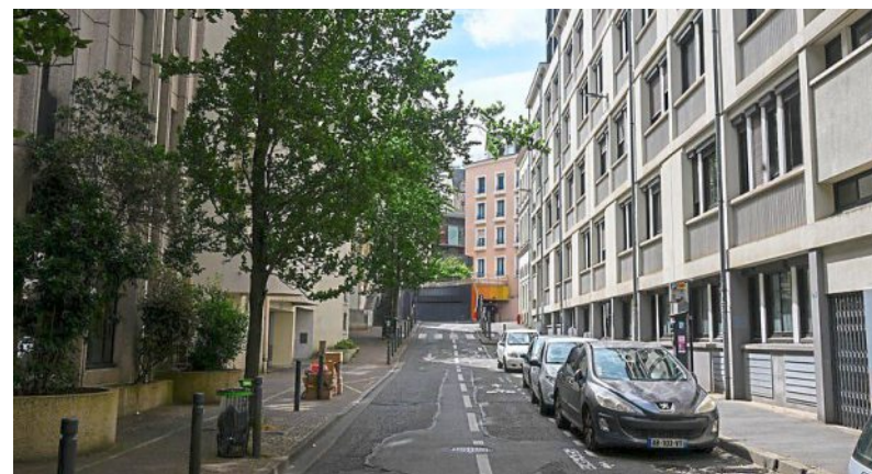
Depuis la rénovation du quartier, la rue est devenue la rue Millet.

c'est aujourd'hui la rue Millet. Bâties en 1875, impossibles à restaurer étant donné leur degré de vétusté, les halles sont démolies en janvier 1971. Le travail est confié à la Compagnie