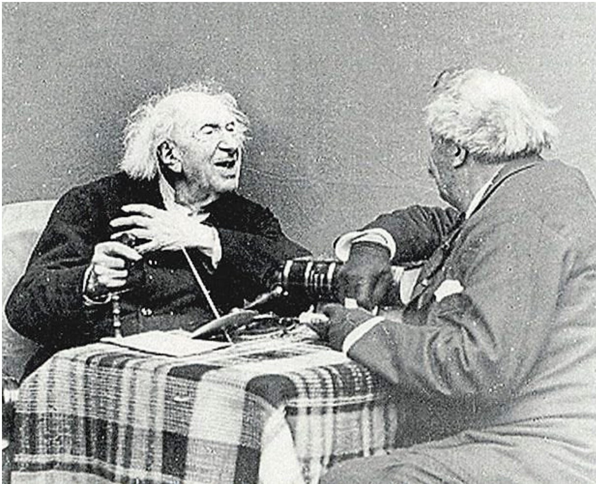
Chevreul et Nadar.

Chevreul : « Pas de tabac. L'odeur m'en a toujours incommodé [...] J'avais la même aversion de tout poisson que des boissons fermentées. Le dégoût d'un grand nombre de légumes et je n'ai jamais pu me résoudre à boire du lait pur. Conclurai-je de là que le poisson, les légumes que je n'aime pas et le lait ne soient pas nutritifs ? Non, certainement, parce que je tiens compte du fait général quoiqu'en opposition avec mon idiosyncrasie. De même, le café me soutient et le chocolat, qui apparaît bien plus substantiel, me