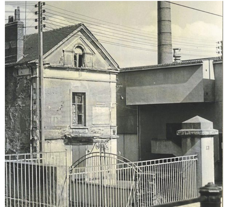
Vue plongeante sur l'entrée de la rue de la Tannerie depuis le bd Gaston-Dumesnil, 1968.