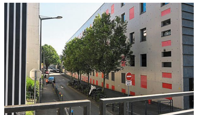
La rue de la Tannerie aujourd'hui.

l'île des Carmes, quai du Rideau. En 1848, les ateliers de fonderie de fer, chaudronnerie et ajustage sont transférés boulevard de Nantes (futur boulevard Gaston-Dumesnil). Le gendre de Berendorf, Alfred Laboulais et le frère de ce dernier développent l'entreprise vers la réalisation de machines à vapeur pour l'industrie, de matériel pour travailler dans les mines, les carrières, les corderies et ficelleries. Elle fournit les machines élévatoires de l'usine des eaux d'Angers. En 1923, ateliers et parcs s'étendent sur plus de 4 000 m 2 en pleine ville. Toutefois, la société est dissoute et liquidée au 1 er janvier 1927. S.B.