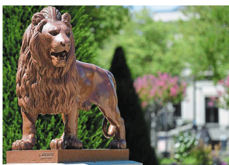
Angers. L'un des lions du jardin du Mail.

Ce n'est pas l'avis d'un groupe d'étudiants angevins : les piédestaux ne sont que des « monuments funèbres » sur lesquels il faudrait inscrire « Ci-gît Hérault ». Quant aux lions, ils sont qualifiés de « malades, boiteux, efflanqués ». Les auteurs de la lettre, publiée par Le Patriote de l'Ouest du 23 avril, espèrent que, sous la pression de l'opinion publique, la muni-