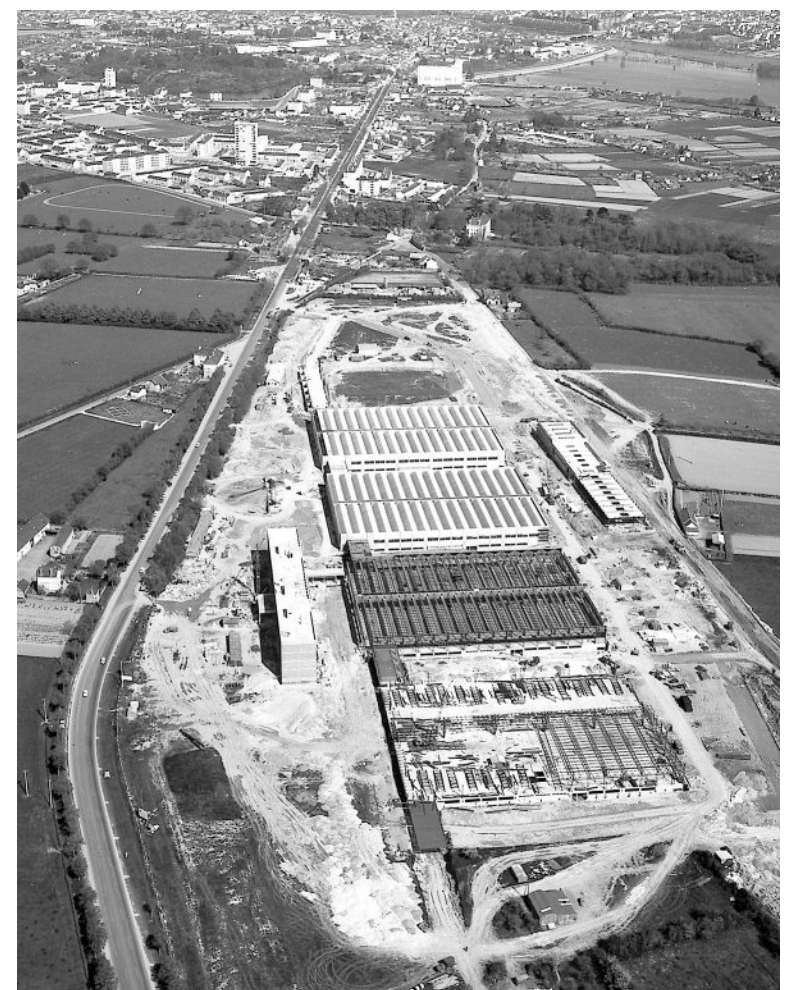
L'usine Bull en construction, le 27 avril 1962.