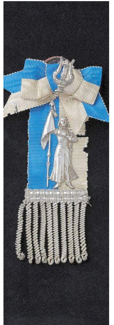
Insigne de la fanfare Jeanne-d'Arc.

l'ordre de mobilisation est décrété, de nouvelles tensions voient le jour. Les musiciens mobilisés, sur le départ, viennent réclamer, avec insistance, leurs indemnités auprès du marquis de Becdelièvre. En sommeil pendant la période du conflit, la fanfare cesse son activité au début de 1920. Le 11 décembre, un devis estimatif des instruments de musique appartenant au marquis est établi en vue de leur vente.