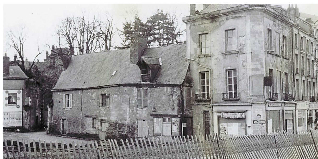
Un quartier en 1966, qui fut longtemps un grand chantier.