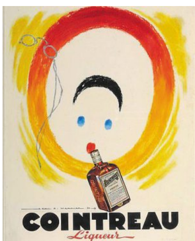
Le dernier rajeunissement du pierrot, par Jean-Adrien Mercier, maquette, aquarelle gouachée, 1950.

PHOTO : ARCHIVES PATRIMONIALES ANGERS, 87 F1 3