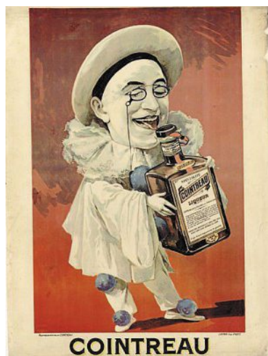
Pierrot de Nicolas Tamagno, affiche, vers 1898.