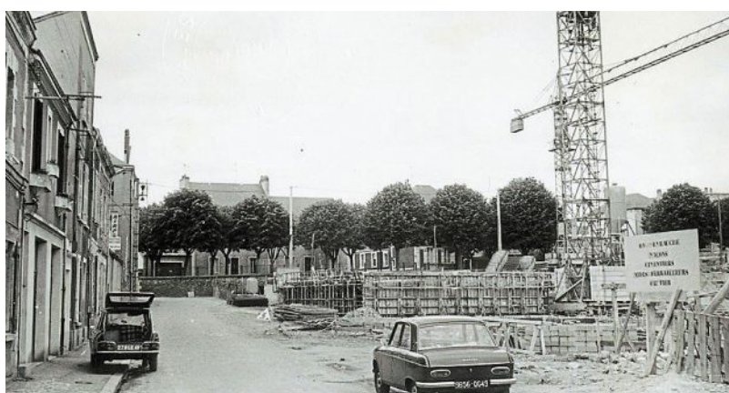
Chantier Saint-Nicolas, rue de la Tannerie, juin 1973.

PHOTO : ARCHIVES PATRIMONIALES ANGERS, COLL. ROBERT BRISSET, 9 FI 4 057