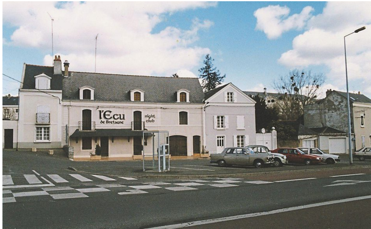
L'Écu de Bretagne, à l'emplacement de l'ancien octroi de la route de Nantes, à l'extrémité du faubourg Saint-Jacques, actuelle place Victor-Vigan (mars 1996).

Ces quartiers Saint-Jacques et Saint-Nicolas, qui sont en train de devenir parmi les plus enviés de la ville, n'avaient pas dans le passé, il faut bien le dire, une réputation extraordinaire. Était-ce leur éloignement du centre ? C'est à peine si les gens d'ici se sentaient Angevins, puisqu'on disait en franchissant les ponts : « Je vais à Angers ». Réciproquement, les Angevins du centre ne venaient pas dans la Doutre. Était-ce l'enchevêtrement de ses rues étroites (rue d'Alger, Saint-François, impasse Bordeaux), les façades délabrées, le manque d'hygiène partout, la misère de ses habitants (curieusement, la misère depuis toujours n'a jamais bonne réputation) ? C'est sans doute tout cela un peu qui donnait de nos quartiers une mauvaise image. Saint-Nicolas, c'est la vieille Doutre [...]. Saint-Jacques, c'était hors les murs. [...] La rue principale de ce quartier, c'était la rue Saint-Jacques, la voie normale pour se rendre d'Angers vers Nantes, à pied, à cheval, en diligence... L'Arche Dorée et l'Écu de Bretagne (ancien octroi) en sont les souvenirs.