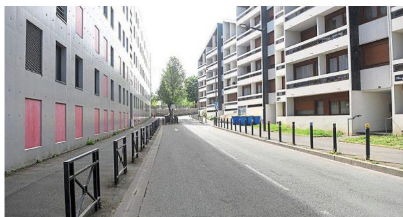
La rue de la Tannerie, vers le boulevard Gaston-Dumesnil.

Des travaux commencent cette année-là grâce à l'Office municipal d'HLM avec la construction de la