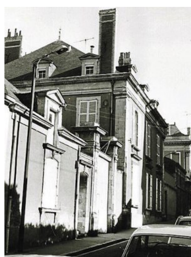
S.B. La rue du Mail.