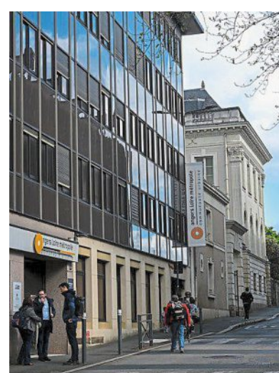
Des bureaux ont succédé à l'ancien hôtel particulier démoli en 1979.