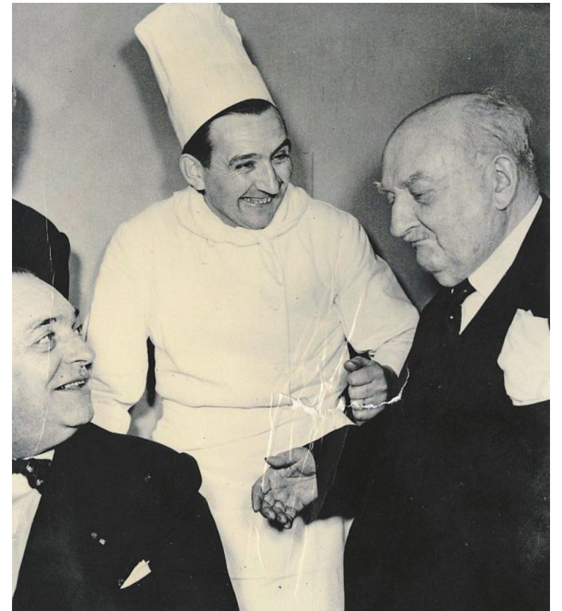
Curnonsky avec un chef cuisinier, avril 1946.