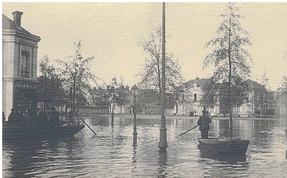
La place Ney, lors des inondations de 1910.

PHOTO : ARCHIVES PATRIMONIALES ANGERS, 5 FI 7428