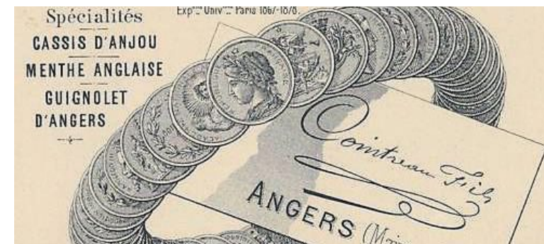
Carte commerciale « Cointreau fils », 1879.

PHOTO : ARCHIVES PATRIMONIALES ANGERS, 50 J 492