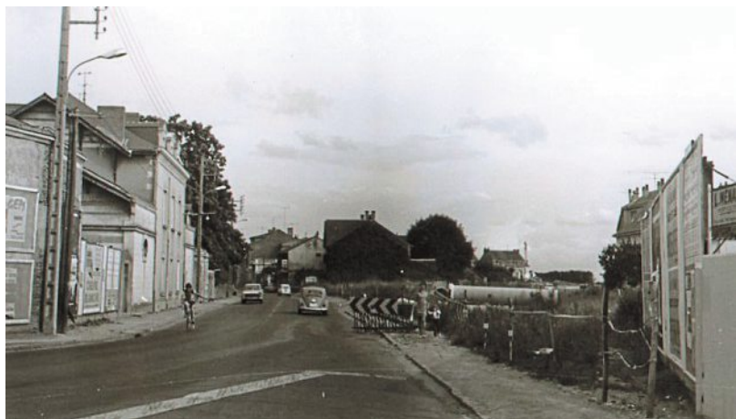
Extrémité de la rue Rabelais vers la rue des Ponts-de-Cé, juillet 1971.

PHOTO : ARCHIVES PATRIMONIALES ANGERS, COLL. ROBERT BRISSET, 9 F1 8340