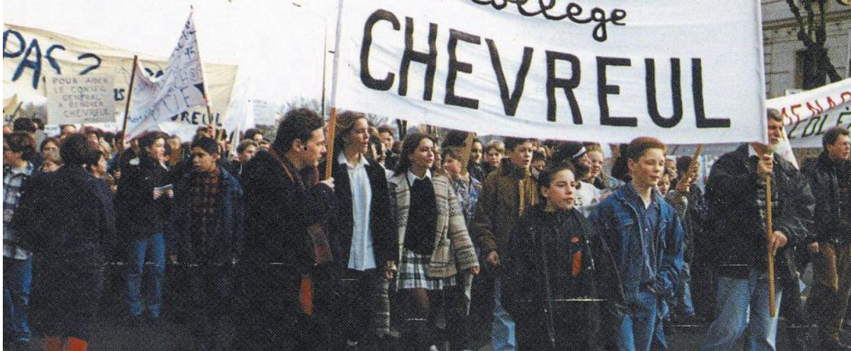
Manifestation pour la rénovation du collège Chevreul, décembre 1994.

PHOTO : AMICALE DES CARTOPHILES DE L'ANJOU, 4 F12 783