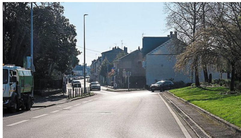
Un peu plus loin, vers l'entrée de la rue des Ponts-de-Cé aujourd'hui.

L'enquête parcellaire pour l'ouverture du boulevard se déroule en 1960. Le projet est déclaré d'utilité publique en septembre 1963, cepen-