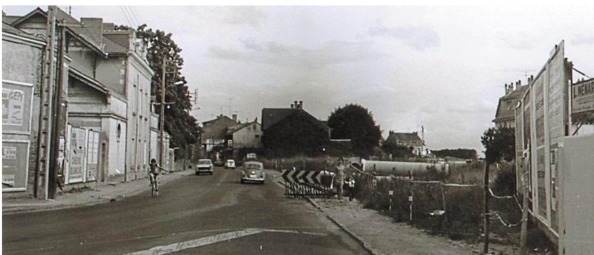
Une rue proche du centre de la ville dans les années 70.

Dans quel endroit de la ville ce cliché a-t-il été pris il y a plus de cinquante ans ? Rendez-vous dimanche prochain.