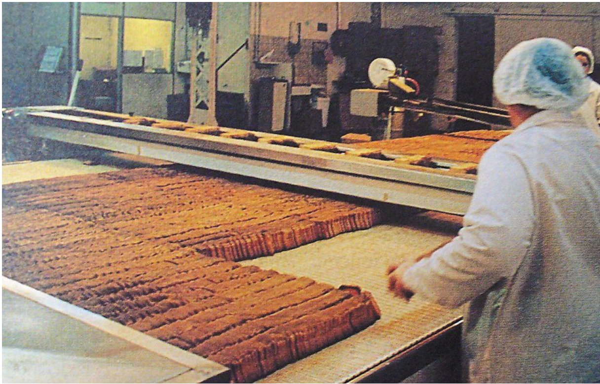
Le conditionnement des biscottes.

L'histoire des Biscottes l'Angevaine a commencé vers 1923, avec les moyens du bord. C'était une biscuiterie. Juste après la Première Guerre, on avait besoin de biscuits pour les rations des soldats en outre-mer. Ils avaient composé un biscuit, le biscuit Colisinet [?], aussi bien destiné aux soldats qu'aux jeunes enfants. Dans les années trente est arrivée une panification qui chan-