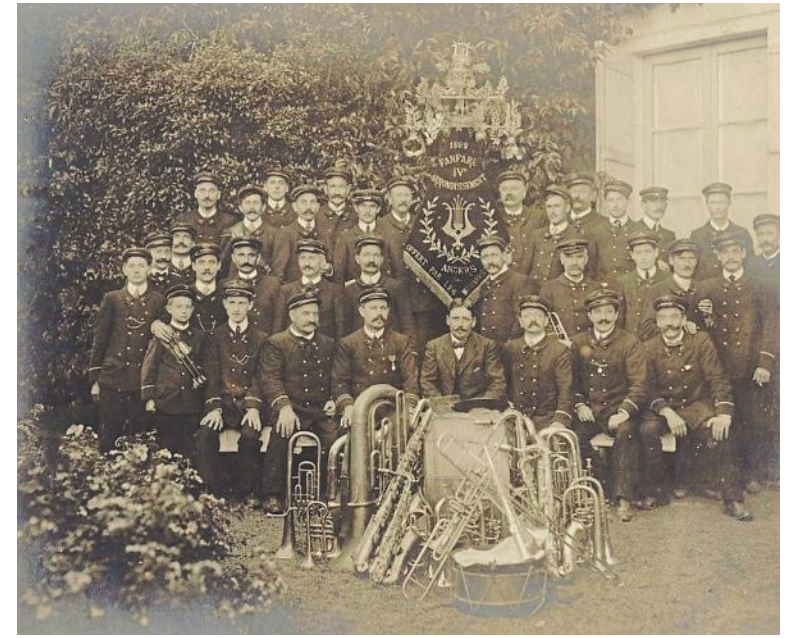
Fanfare du IV e arrondissement, 1913.

« Angers en fanfare » : une nouvelle exposition à découvrir