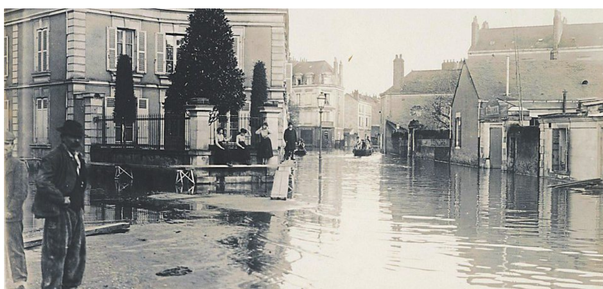
Lors des inondations de 1910.