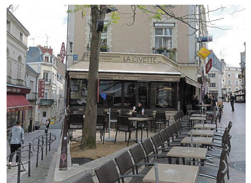
L'ancien 19, rue des Poëliers devenu le bar de la Civette en 1894.