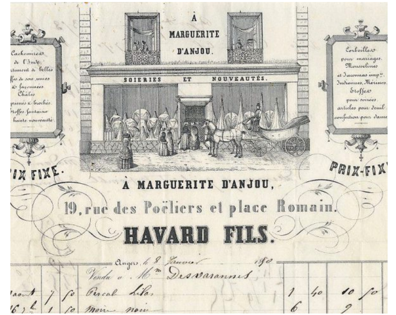
À Marguerite d'Anjou, 19, rue des Poëliers et place Romain. Facture à en-tête, 8 janvier 1850.