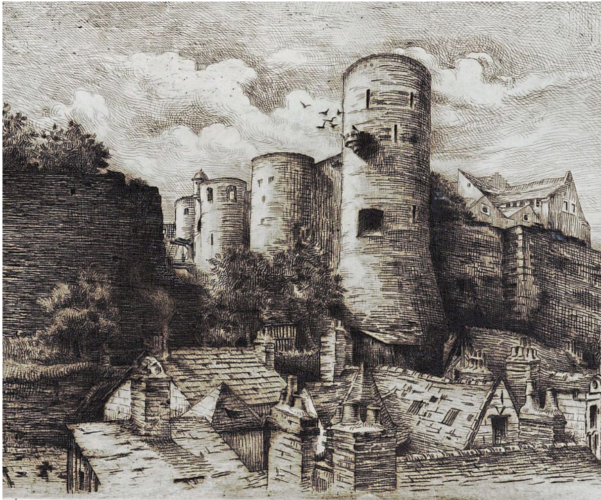
Le château d'Angers, par Alphonse et Gabriel Chanteau, eau-forte, vers 1920.

Et d'autant que pour ladicte demolition il conviendra faire des fraiz, lesquels noz finances ne peuvent porter et dont nous desirons aussi que demouriez deschargez autant qu'il sera possible, nous avons ordonné que les matériaux sortans de ladicte desmolition seront venduz aux plus offrans et derniers encherisseurs et que les deniers qui en proviendront seront emploiez ausdicts fraiz selon qu'il est amplement contenu en nosdictes lettres patentes, mais comme vous et les aultres habitants de ladicte ville et faulxbourgs d'Angers estes ceux qui vous resentez principalement de la commodité de ladicte reduction et que nous vous gratifions davantaige de la demolition et razement dudict chasteau par ou vostre repos et liberté demoureront grandement assurez pour l'advenir,