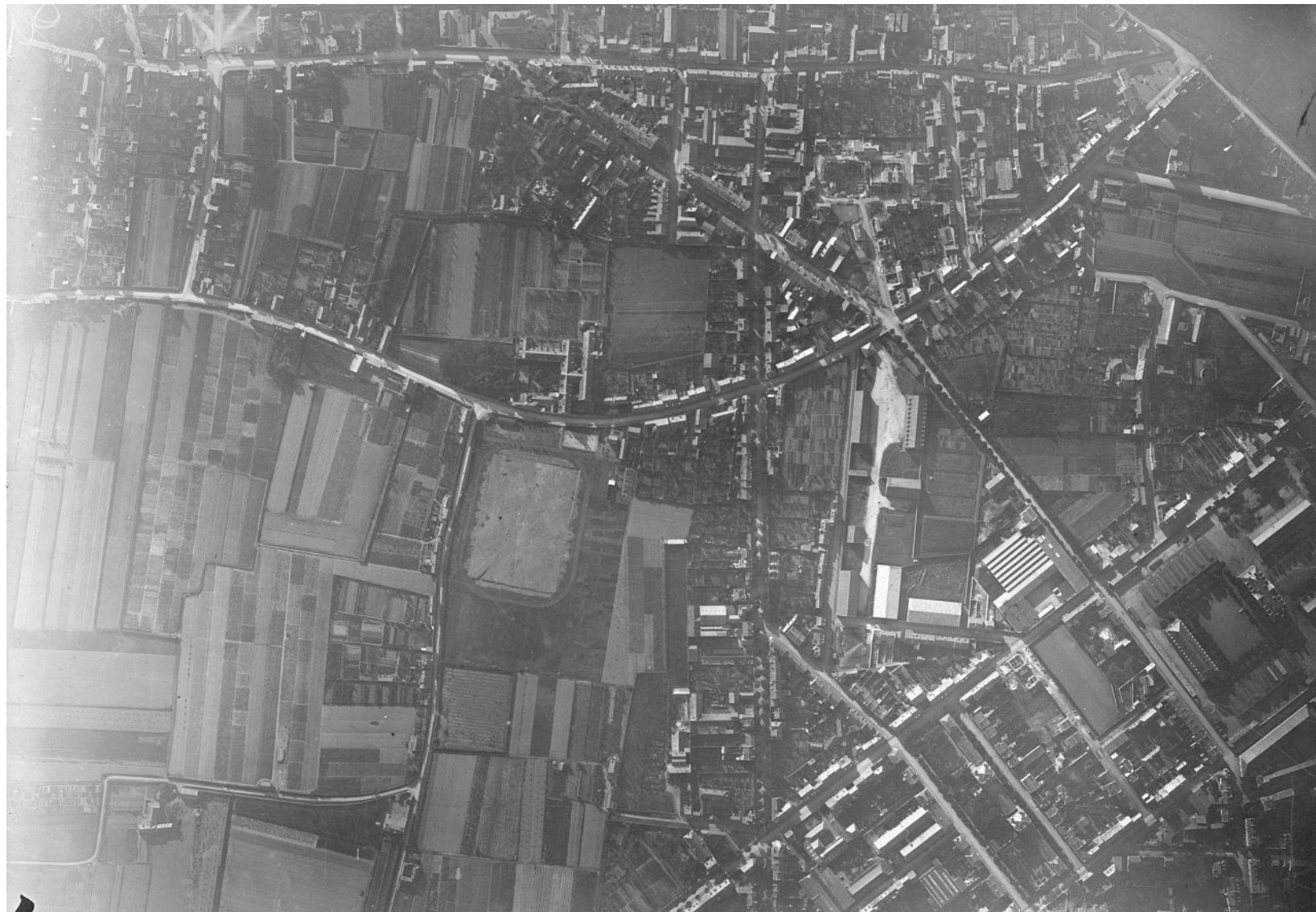
Une vue aérienne du stade de l'Intrépide, rue de Frémur, vers 1926-27.