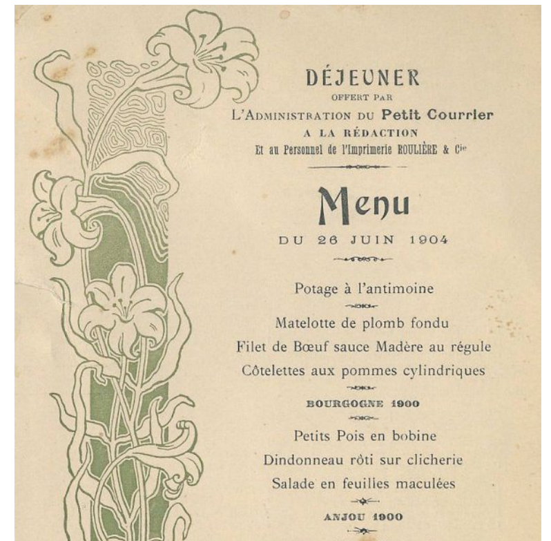
Un drôle de menu.

En 1904 au « Petit Courrier », un menu particulier offert à la rédaction