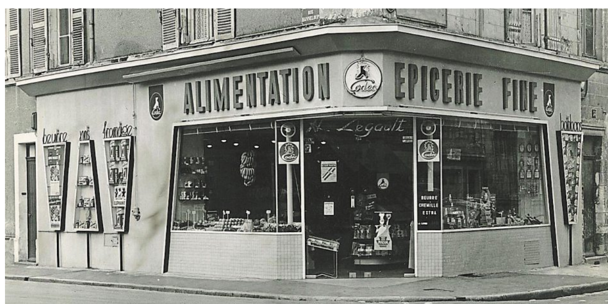
Magasin Codéc, vers 1960.