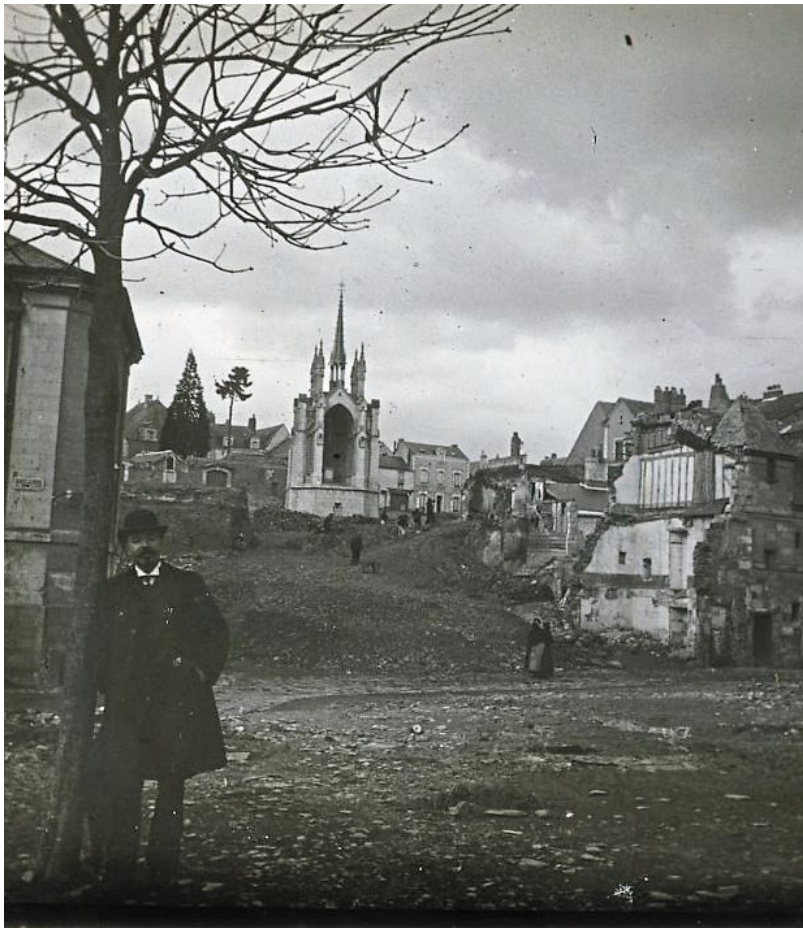
Percée de la rue du Reposoir, dénommée rue Godard-Faultier. 1905.

Rien n'était plus fatigant que ce jour. La ville était noire de monde. 20 à 30 000 étrangers s'y pressaient. Le défilé chatoyant était célèbre par toute la France. La procession qu'on fait à Angers le jour de la Fête-Dieu, écrit Louis Coulon en 1644 dans son ouvrage Les rivières de France [...] et autres curiosités remarquables dans chaque province, « est une des plus augustes cérémonies du royaume ». Il fallait l'avoir vue au moins une fois dans sa vie.