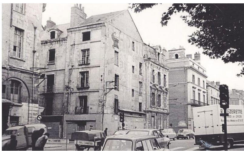
La rue Baudrière, à son débouché sur le quai Ligny. Juin 1976.