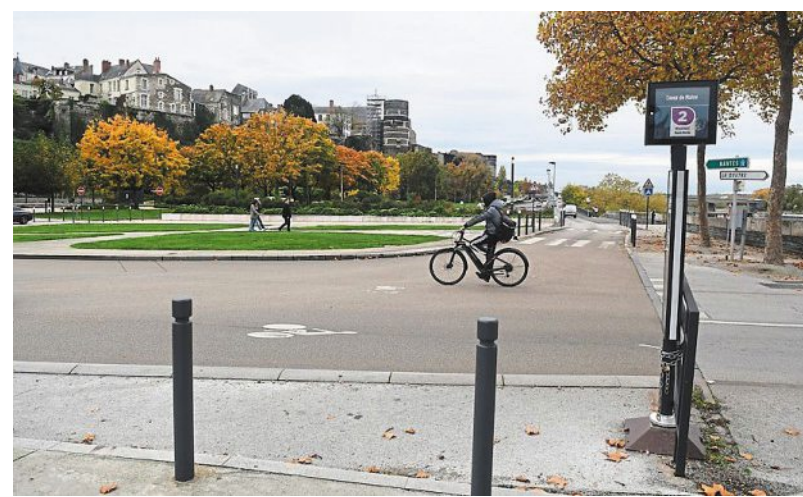
Dans le paysage actuel, les immeubles du bas de la rue Baudrière, qui descendait jusqu'au pont de Verdun, ont tous disparu. PHOTO : CO. MICHEL DURIGNEUX

PHOTO : ARCHIVES PATRIMONIALES ANGERS, COLL. ROBERT BRISSET, 9 FI 13 133