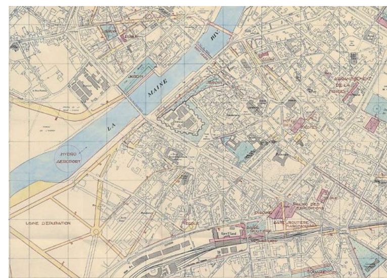
Plan d'aménagement, d'embellissement et d'extension, 1934.

L'ensemble de ces fonds est à découvrir sur : archives.angers.fr.