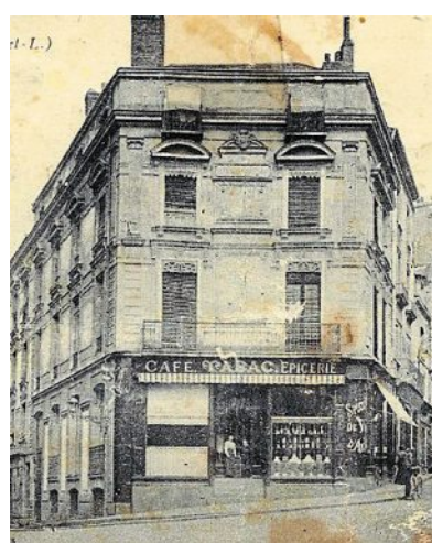
Carrefour rue Millet – rue Baudrière, carte postale, vers 1920.

PHOTO : ARCHIVES PATRIMONIALES ANGERS, 4 Fi 1912