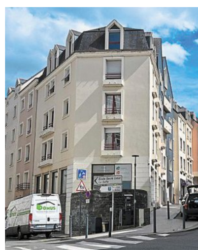
Le carrefour est toujours reconnaissable aujourd'hui.

PHOTO : ARCHIVES PATRIMONIALES ANGERS, 4 Fi 1912