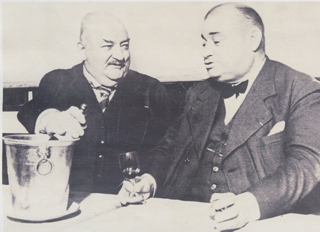
Curnonsky et son ami le docteur André Robine. Photo extraite de Simon Arbellot, Curnonsky, Prince des gastronomes, Paris, Les Productions de Paris, 1965.

Grand ironiste, Maurice-Edmond Sailland, dit Curnonsky, a remis à l'honneur à compter de 1919 les cuisines régionales.