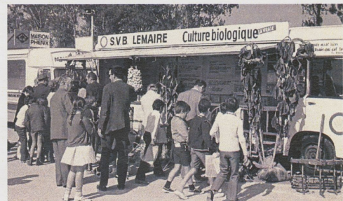
Un camion publicitaire Culture biologique du SVB (Service de vente des blés) Lemaire, lors d'une foire en 1972. Fonds Lemaire, Archives municipales d'Angers, 48 F1 2073

Le site internet des Archives municipales d'Angers, déjà riche de près d'un million de pages de documents et clichés, va s'enrichir avec la mise en ligne prochaine, par Bruno Amiot, responsable de la Photothèque, des 4 812 photographies du fonds de l'entreprise Lemaire.