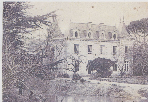
Le manoir de l'Arceau (vers 1910) a donné son nom au quartier. Archives municipales, coll. Robert Brisset, 9 Fi 1141. À droite, photo CO - Laurent COMBET

Le manoir de l'Arceau, ici vers 1910, a donné son nom au quartier qui s'étend au-delà du cimetière de l'Est vers Saint-Barthélemy-d'Anjou. Il a