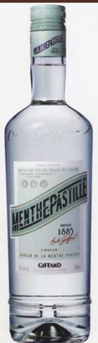
GIFFARD DEPUIS 1885