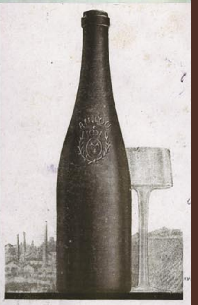
LA BOUTEILLE A VIN d'ANJOU